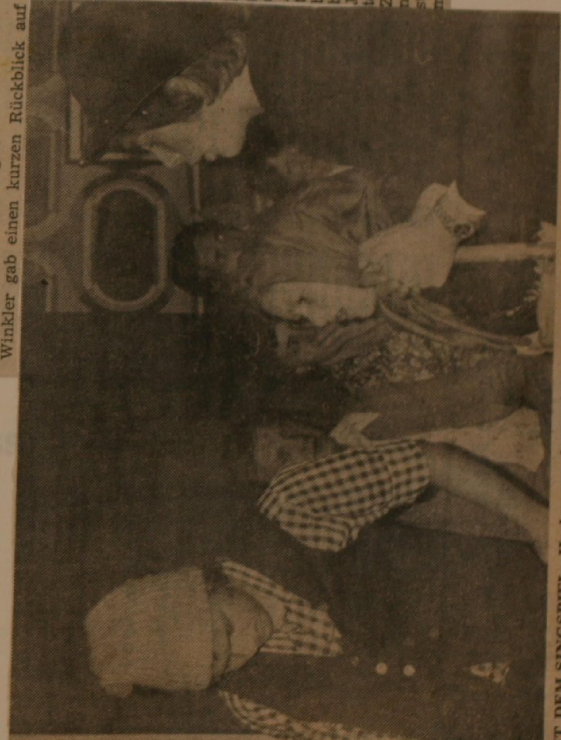
MIT DEM SINGSPIEL „Herbergssuche“ erfreute die Jugend die 300 Teilnehmer an der Weihnachtsfeier der Lagerlechfelder Spielvereinigung im Vereinslokal.