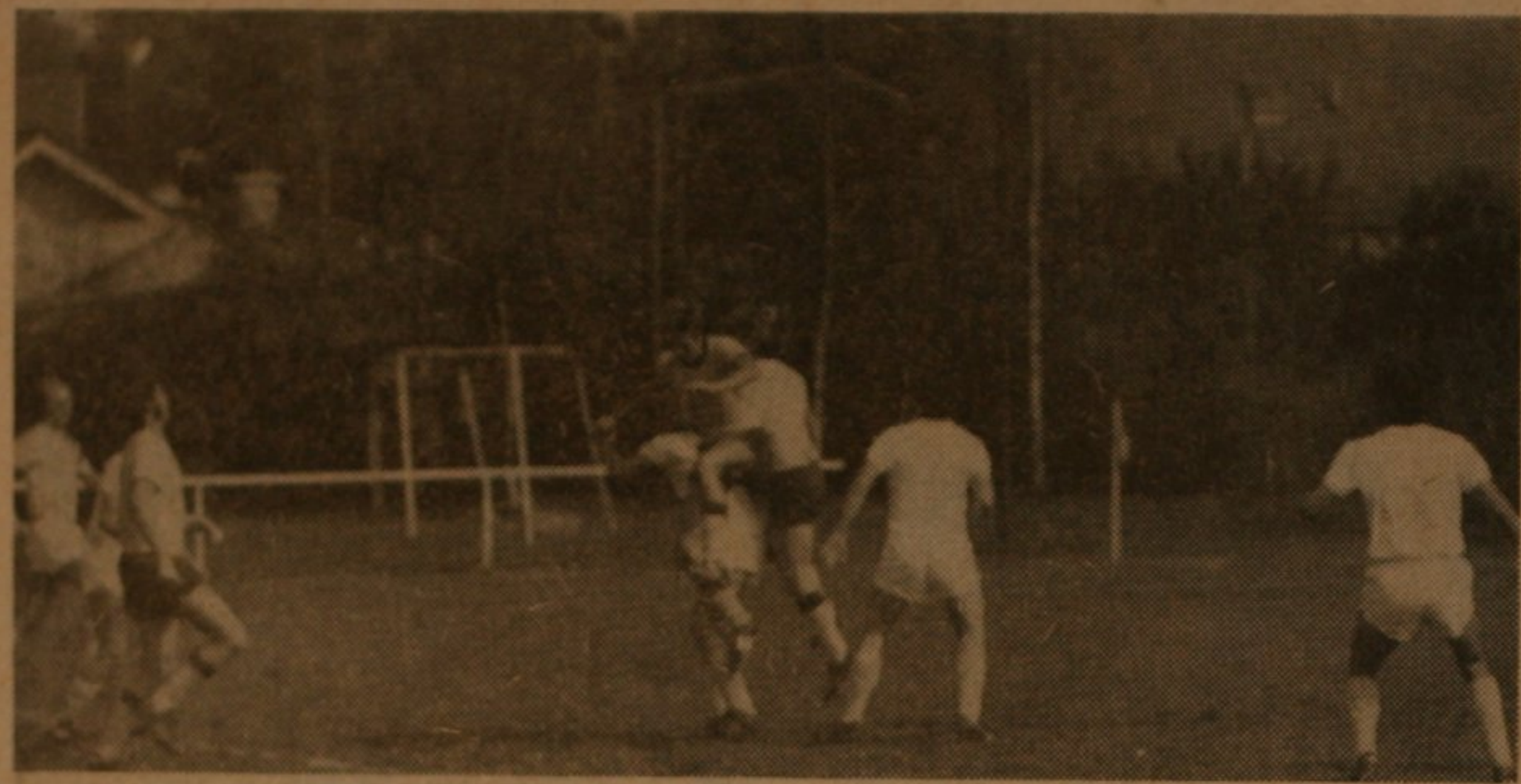
VIEL KAMPFGEIST zeigten die SpVgg Lagerlechfeld und der PSV Augsburg.