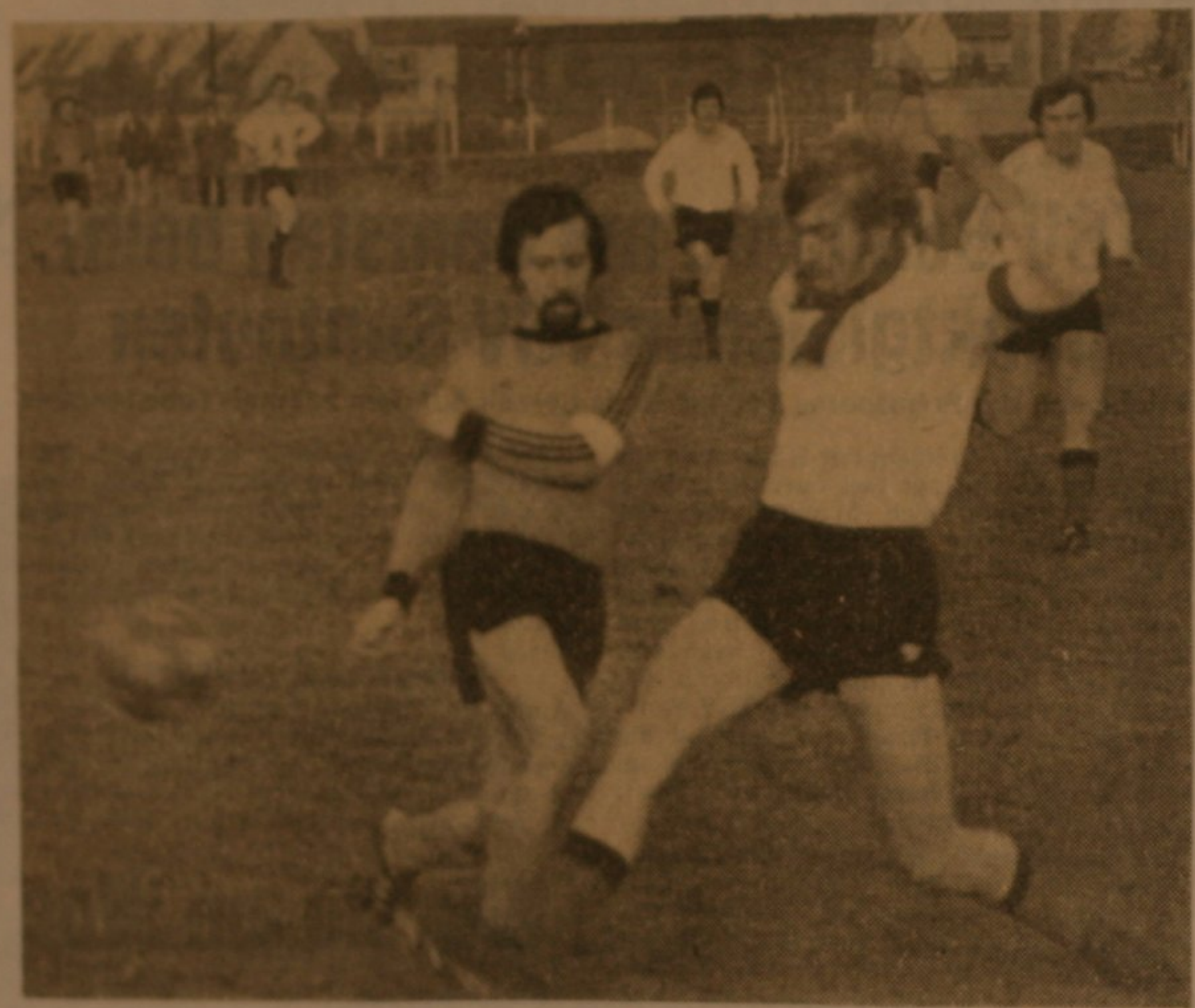
SPVGG — TSV SMÜ 0:1